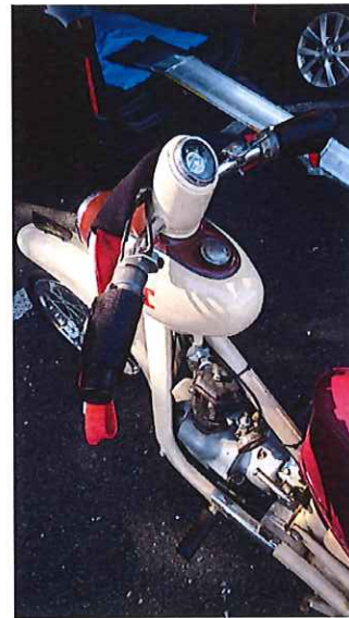
20年早すぎた悲劇のスクーターAS71