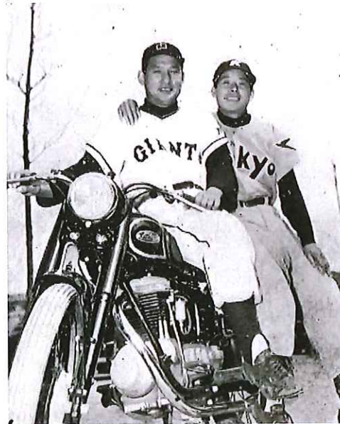
努力の人川上哲治らしい色紙

右はライラックタイムス42号表紙の長嶋茂雄。昭和33年12月15日発行とありますので、プロ野球デビューの年です。いきなり本塁打王、打点王を獲得、新人王に輝きました。ただ昭和33年の白黒テレビ普及率は30%。この直後に白黒テレビ普及率は急上昇し、読売グループの新聞、テレビを駆使したメディア戦略もあり、「巨人 大鵬卵焼き」の時代となります。全国区の巨人軍選手を宣伝に起用したのは先見の明がりましたが、オートバイと同じく少し早すぎました。この後、R92を発売していた昭和40年には白黒テレビ普及率は90%となり本格的なテレビの時代到来、そして巨人V9と続きます。