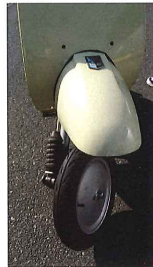
当時としては画期的な片持ちサスと樹脂製フェンダー