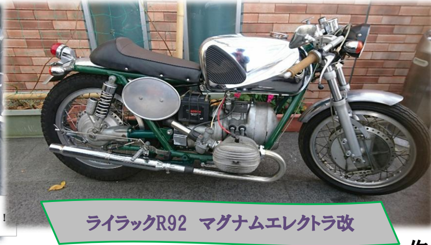
ライラックR92 マグナムエレクトラ改