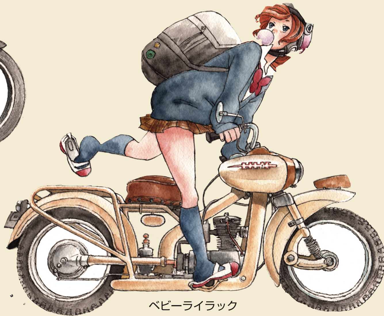
ベビーライラック